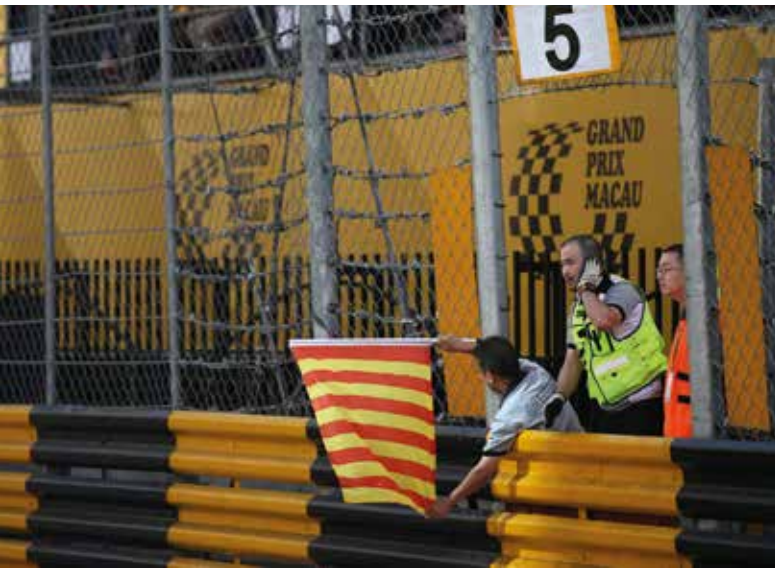
旗號員為參賽車手提供必要資訊