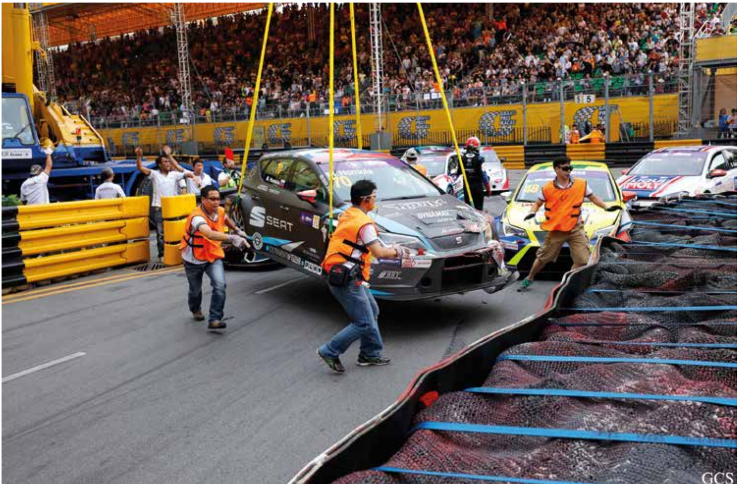
澳門的無名英雄在馬不停蹄地工作

除了為澳門格蘭披治大賽車提供至關重要的幫助外，澳門賽事工作人員的技能和投入亦深受每年11月來澳參賽的車手的讚揚。賽車手和電單車手依靠賽事工作人員來告訴他們前方路段的狀況，並在發生事故時得到他們的協助。🏁