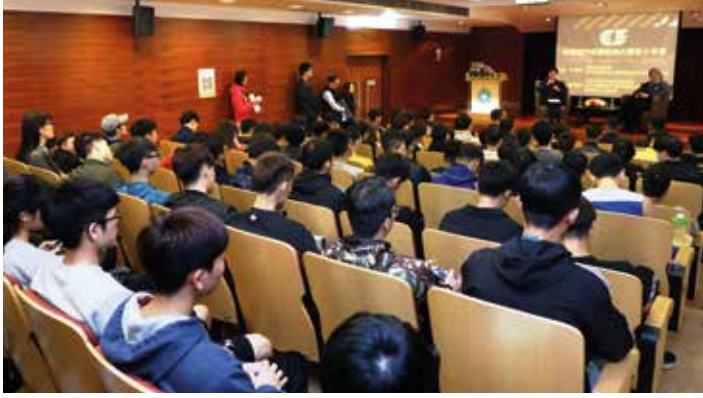
澳門格蘭披治大賽車組織委員會於今年先後在澳門多間院校舉行「認識澳門格蘭披治大賽車分享會」

學生們透過分享會，對大賽車作為澳門體壇盛事及其歷史、工作人員所需的技能和每年進行的準備工作等方面，有更多的認識和了解。