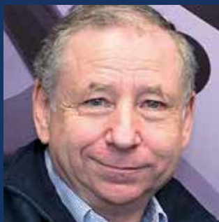
國際汽車聯合會主席托特 (Jean Todt) 先生

「志願者是賽車運動界的無名英雄。沒有他們，我們便不能舉行比賽。認可志願者的辛勤付出對國際汽聯而言是非常重要的，而設立志願者週末則更能彰顯他們在全球各地，為比賽能夠安全並順利進行的無私奉獻和付出，同時帶出投身志願者從工作中獲益良多等優點，從而吸引更多新血加入。」