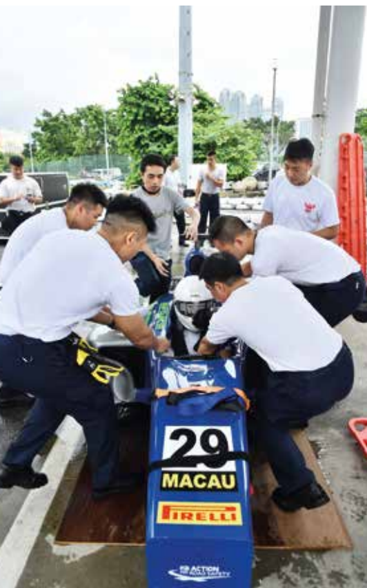
今年的賽道官員及賽事工作人員培訓經已開始